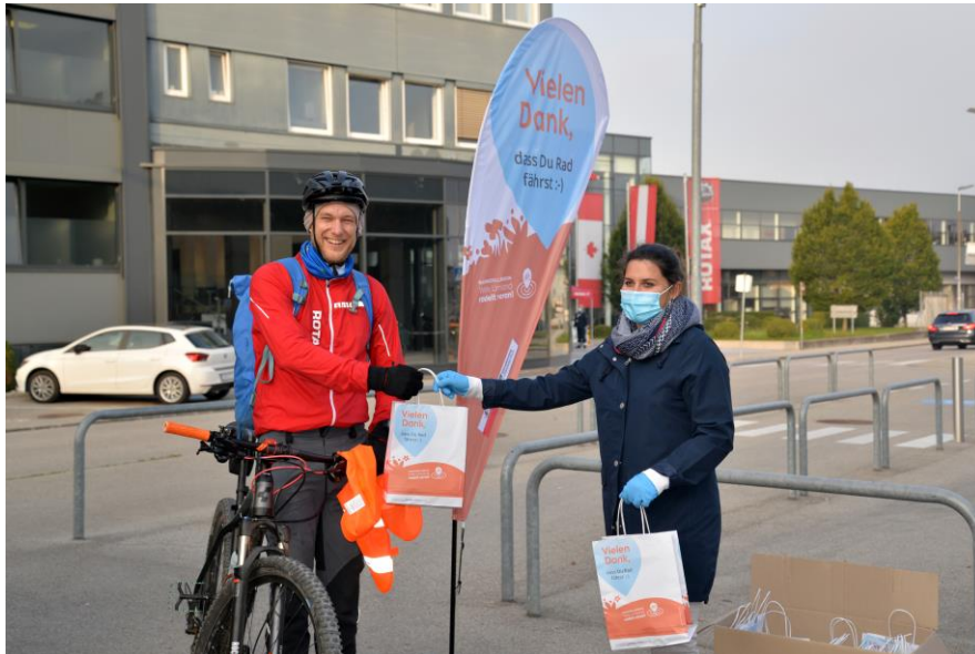
Frühstückspakete als Dankeschön.

Gunskirchen, 22. September 2020 - Als voller Erfolg erwies sich der Autofreie Tag bei BRP-Rotax. Dieser findet jährlich im Rahmen der europäischen Mobilitätswoche statt. Eine Initiative der Europäischen Kommission zum Schutz von Umwelt und Gesundheit.